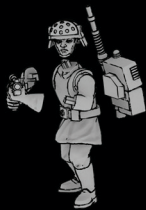
IMPERIALER KOM-TECHNIKER SWL_0101