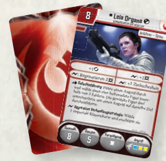
3 Aufstellungskarten (2 Leia Organa, Auf diplomatischer Mission)