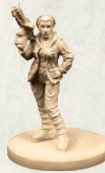
1 Plastikfigur (Leia Organa)