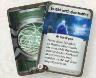
3 Befehlskarten (Es gibt noch eine andere, Ich fühle es, Hinter feindlichen Linien)