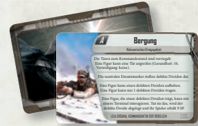
2 Gefecht-Einsatzkarten (Nelvaanisches Kriegsgebiet)