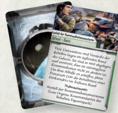
1 Nebeneinsatzkarte (Ausfall der Kommunikationssysteme)