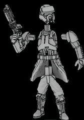
IMPERIALE-STRANDTRUPPEN- EINHEITENFÜHRER SWL_0163