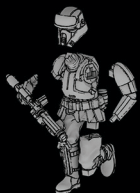
IMPERIALER STRAND- TRUPPLER SWL_0167