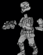
IMPERIALER STRAND- TRUPPLER SWL_0164