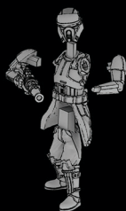
IMPERIALER STRAND- TRUPPLER SWL_0166