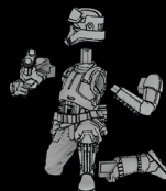
IMPERIALER STRAND- TRUPPLER SWL_0165