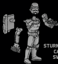
STURMTRUPPEN- CAPTAIN SWL52-A