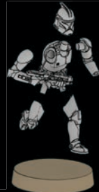
PHASE-I- KLONTRUPPLER SWL_0190