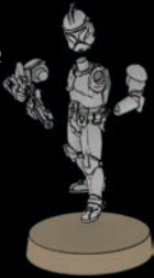
DC-15-PHASE-I- TRUPPLER SWL_0192