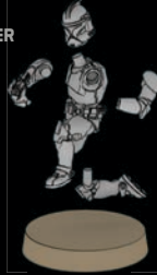
PHASE-I- KLONTRUPPLER SWL_0191