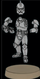
PHASE-I- KLONTRUPPLER SWL_0188