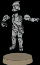
PHASE-I- KLONTRUPPEN- EINHEITENFÜHRER SWL_0187