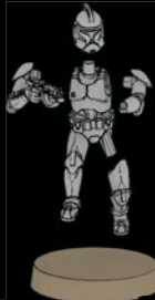
PHASE-I- KLONTRUPPLER SWL_0189