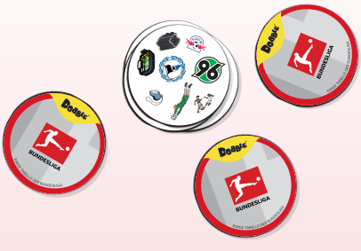
So fangt ihr an: (Beispiel für eine Partie zu dritt)