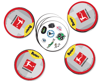
So fangt ihr an: (Beispiel für eine Partie zu viert)