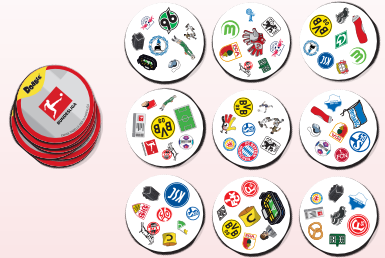
So fangt ihr an: