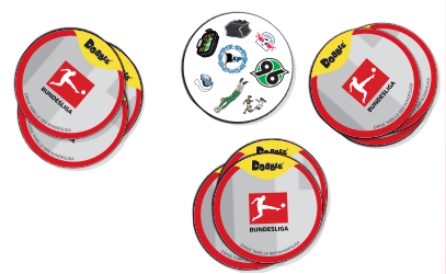
So fangt ihr an: (Beispiel für eine Partie zu dritt)