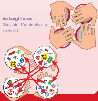
So fangt ihr an: (Beispiel für eine Partie zu viert)