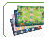
4 Spielpläne (8 Schlachtfelder)